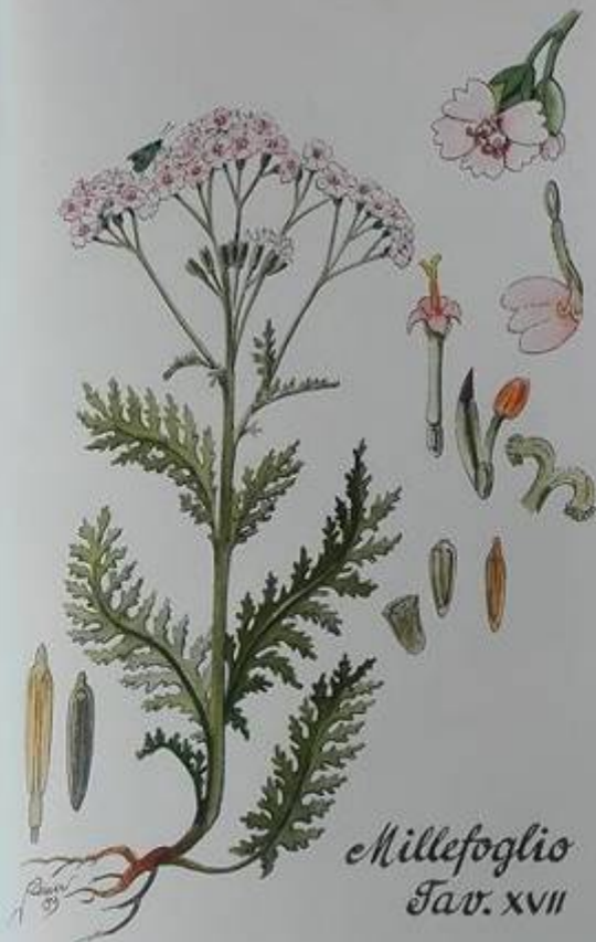
Millefoglio Fav. XVII